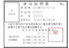
▲水道部発行の身分証明書