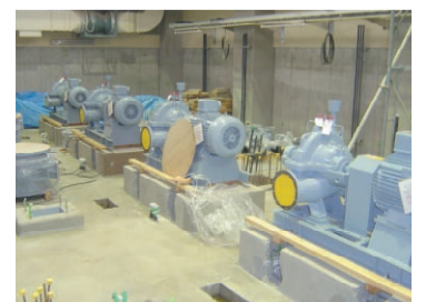
配水ポンプ室 [地階]