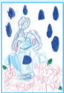
ニコニコ笑顔がすてきで賞

水道まつど第90号において、松戸市水道部キャラクター「まってい〜」のイラスト(似顔絵)を募集しました。ご応募いただいた作品を是非ご覧ください♪