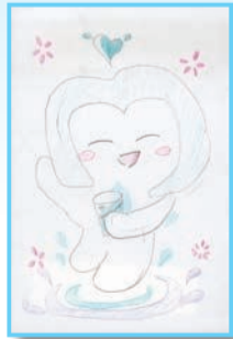
おいしい水道水に満足で賞