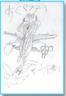
まってい〜の新たな一面が見れたで賞