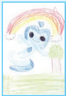
虹が見れてうれしそうで賞