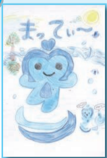
水面に映る絵が芸術的で賞