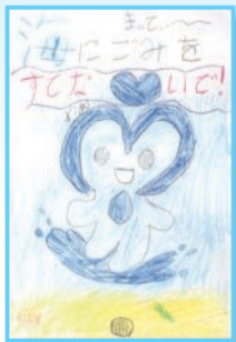
自然を大切にしているで賞