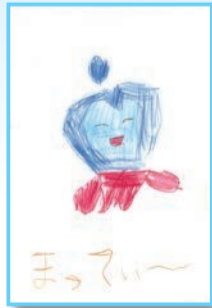
赤い洋服がかっこいいで賞