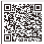
ちば電子申請サービス