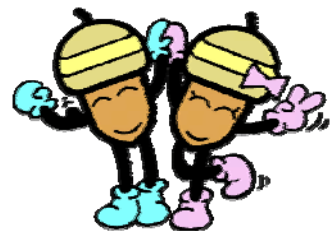
21世紀の森と広場シンボルキャラクター ドンちゃん・グリちゃん

発行日：2008年10月1日 発行：21世紀の森と広場パークセンター 開館：9：00～16：30 （11月1日から、2月末日までは） 9：00～16：00 月曜休館（祝日開館/翌日休館） 〒270-2252 松戸市千駄堀269 TEL 047-345-8900 http://www.city.matsudo.chiba.jp/