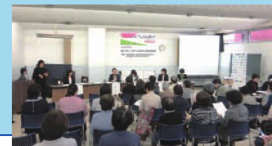
ゆうまつどフェスタ基調講演の様子