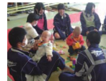
中高生と乳幼児のふれあい体験事業