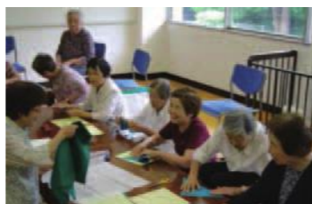
ふれあい・いきいきサロン