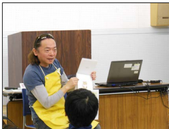
昨年の読み聞かせライブ