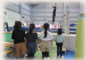
自由项目体验团 体验跳跳床