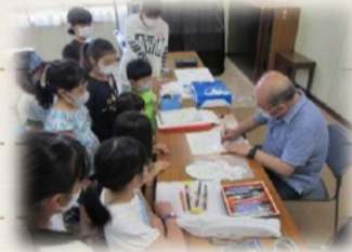
自由项目体验团 画鸟兽戏画!