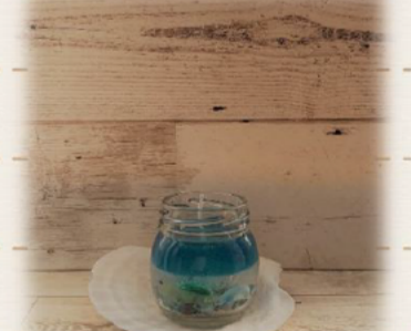
制作照亮心灵的玻璃烛杯