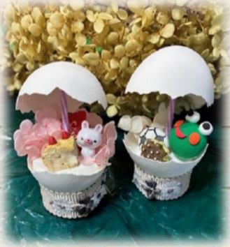
神奇蛋壳的秘密~将雨伞下的世界封印在内~ 蛋壳教室