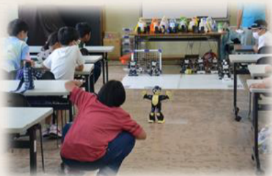
边玩边学! 机器人教室!