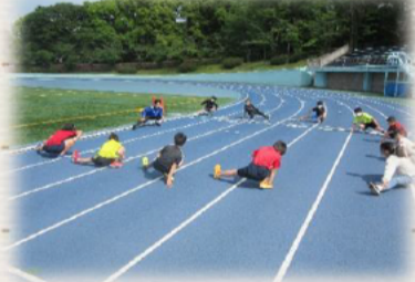
挑战最快速度! 破解快速之谜! 赛跑教室