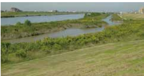
通水から約1年後のふれあい松戸川

当初、この浄化水は導水管で地下を通す計画でしたが、市民からの提案もあり、開放型の川にすることになりました。そして川辺は人工的な護岸ではなく、既存の自然環境の再生力にまかせる自然工法が採られました。こうして珍しい河川敷の人工河川、ふれあい松戸川が誕生したのです。