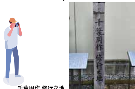
千葉周作 修行之地

春雨橋から市民劇場へ向かう間に、3つの寺があります。宝光院、善照寺、西蓮寺です。善照寺の入口にある案内板によると、剣豪・千葉周作が少年時代に松戸宿に住み、このあたりにあった道場で修行をしていたそうです。