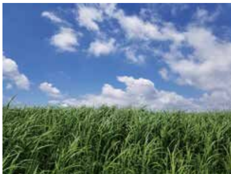
初夏のヨシ原 (古ヶ崎)