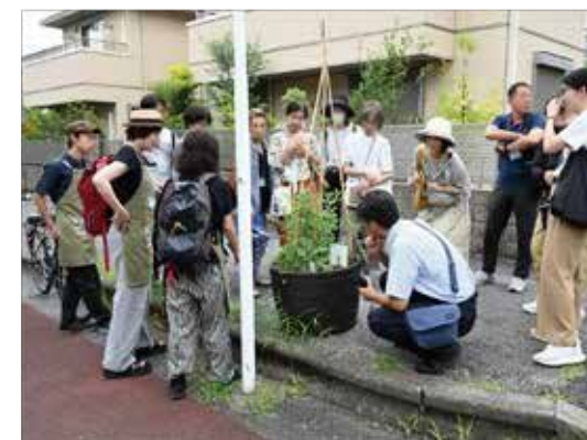
EDIBLE WAY 見学ツアー