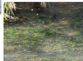
水草が揺れる水面