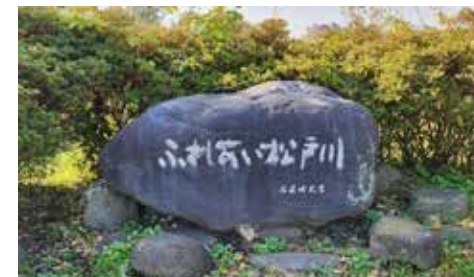
「ふれあい松戸川」碑

小山地先から葛飾橋まで足を延ばしてみましょう。この橋の中ほどから松戸市街をふり返ると、とても印象的な風景が広がります。松戸地区の中心市街が、まるで江戸川の水の上に浮いているように見えます。ふれあい松戸川散歩の締めくくりにふさわしい「川のまち・松戸」の眺めです。