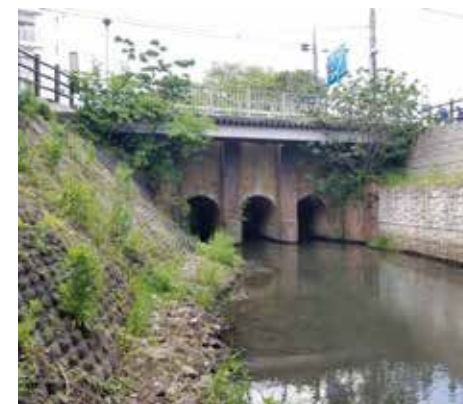
小山樋門（通称：レンガ橋、めがね橋）

建設は約130年前の1898(明治31)年。県内に現存するレンガ造りの河川構造物で、しかも現役で利用されているものとしては最古です。また、平成28年度に土木遺産に認定されました。