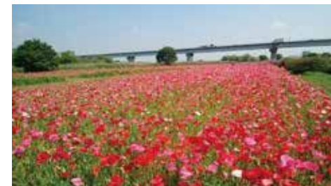
フラワーライン春(ポピー)

官民「協働のまちづくり」あるいは「パートナーシップの川づくり」という言葉が聞かれ始めたころです。フラワーラインの取り組みは、松戸におけるその先駆けとも言えます。