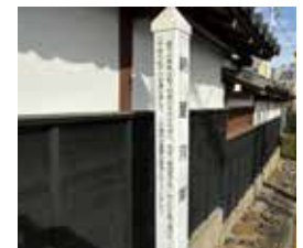
納屋河岸 案内標識