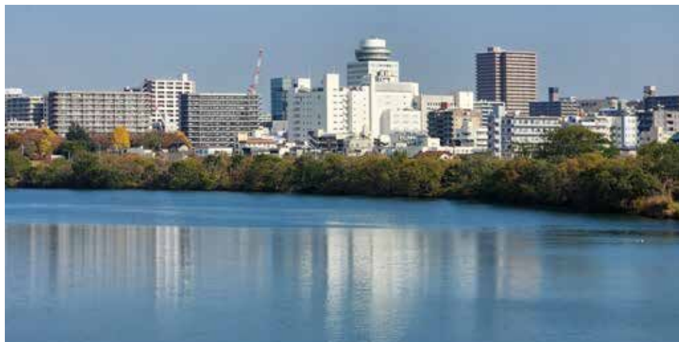
葛飾橋から望む松戸市街

古ヶ崎の浄化施設は、坂川の水質が大きく改善されたことから、その役目を終え、現在は稼働しておらず、ふれあい松戸川の水は江戸川から導水されています。