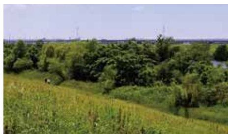
堤防からの河畔林

すごいですね。水は流れがあれば自然に浄化されていくのです。その一方で水環境も含め、一度壊された自然を再生させようとすると、ものすごい費用と労力、時間がかかることも、ふれあい松戸川の事業は物語っています。