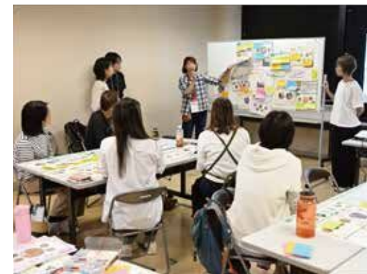
ワクワクミーティング