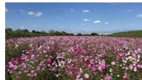
フラワーライン秋(コスモス)