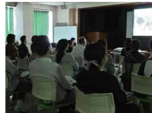
「EDIBLE CITY 都市を耕す」映画上映会