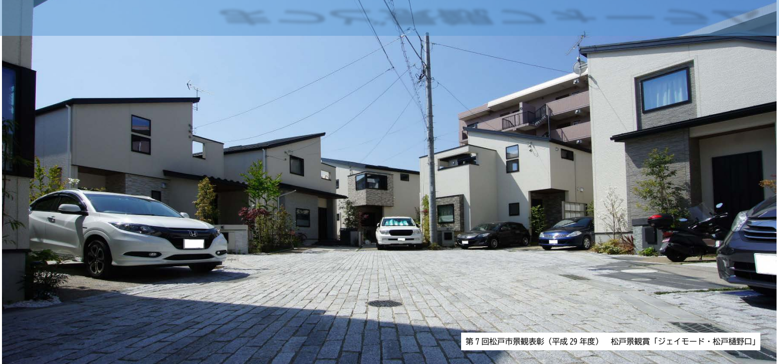
第7回松戸市景観表彰（平成29年度） 松戸景観賞「ジェイモード・松戸樋野口」