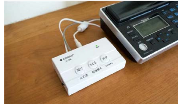
電話de詐欺撃退機器 (自動通話録音機)