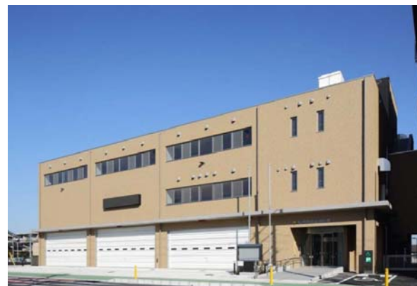
ちば北西部消防指令センターが入る 松戸市中央消防署 新庁舎