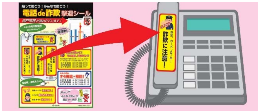
電話de詐欺撃退シール