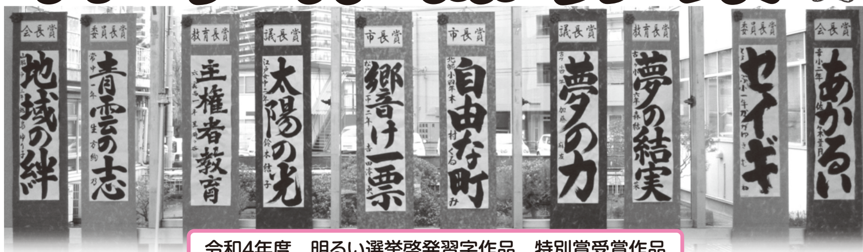
令和4年度 明るい選挙啓発習字作品 特別賞受賞作品