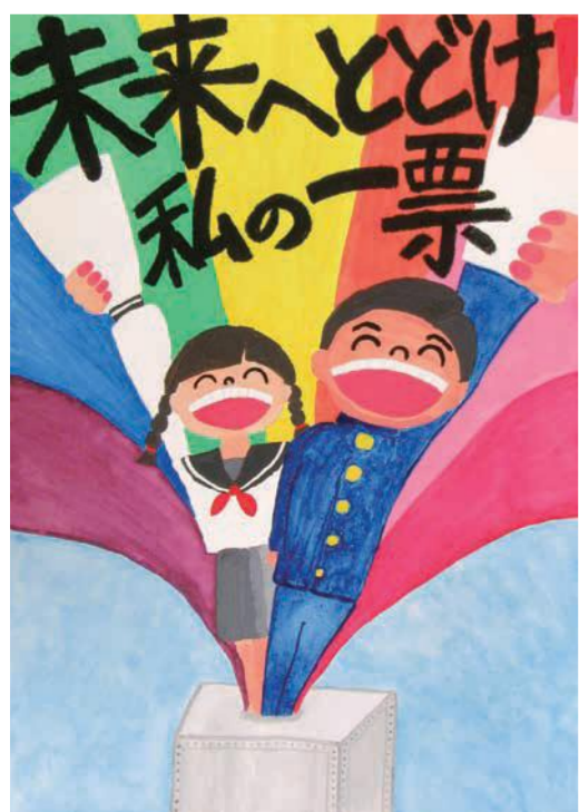
上本郷小学校 6年 花嶋 都光