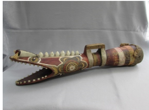
トゥムトゥ（パプアニューギニア、木製にトカゲ皮）