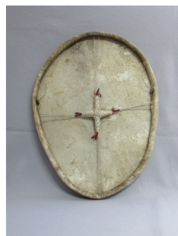
ウントフ（ロシア、トナカイ皮）