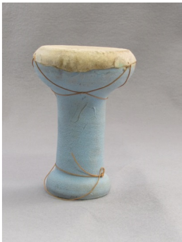
タラブッカ（イスラエル、素焼きに羊皮）