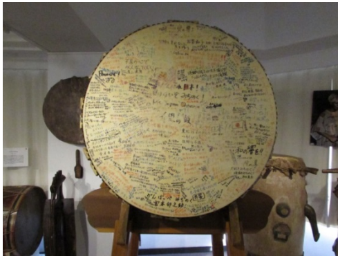
希望の鼓（日本、東日本大震災関連）