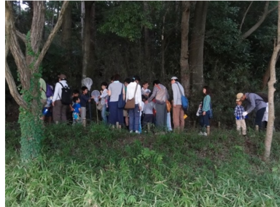
写真2 「夜の生きもの観察会」(取材可)