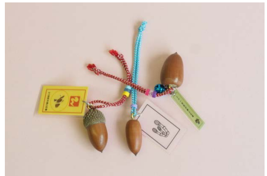
写真4 プレゼント(参加賞)