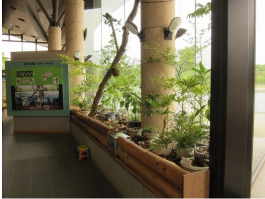
写真1 館内の「森のジオラマ」