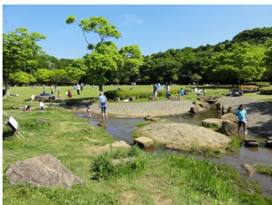
写真5 湧き水での水遊び