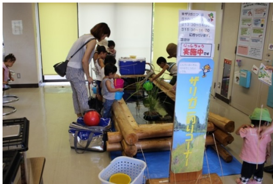
写真3 館内の「ザリガニつりコーナー」