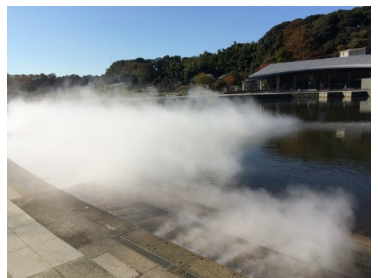
写真6 霧噴水(水道水使用)