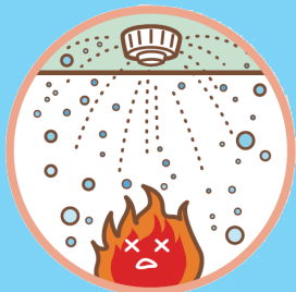
スプリンクラー設備