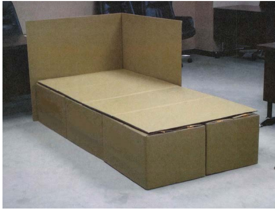
段ボール製簡易ベッド