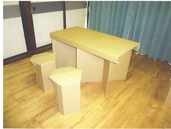
段ボール製イス・机