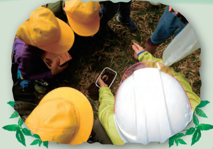
何かをハッケン！虫かな...？