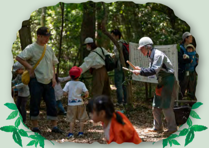
森の中は大きな遊び場！「楽しい」がいっぱい！！