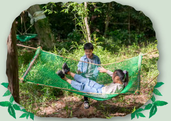
ハンモック楽しいよね！大人も乗れます！