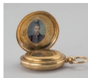
徳川昭武がスイスの政治家から贈られた金の懐中時計(左)