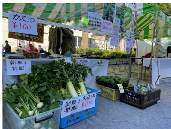
(過去開催時の様子)