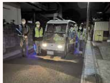
【グリーンスローモビリティの運行の様子】