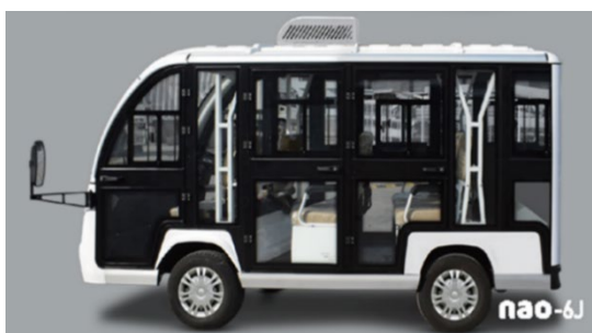
実証調査で使用する車両「タジマ製 NAO-6J」

グリスロの導入により、人と人がつながるコミュニケーションツールとして期待できるものであり、地域の方々の社会参加を促進することで、地域コミュニティの活性化や自立支援にもつながります。