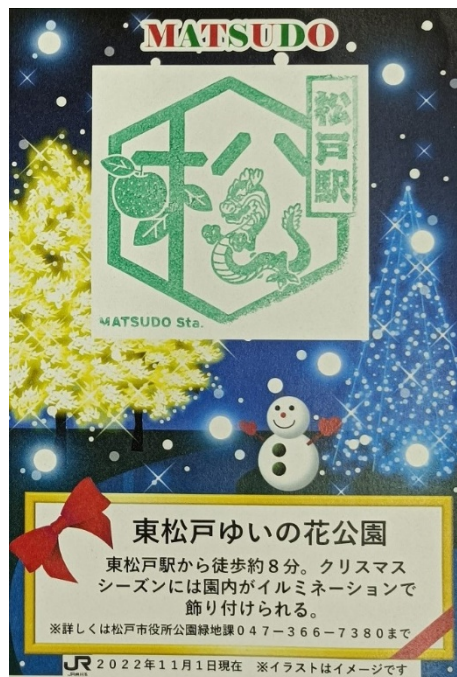
(スタンプ台紙画像)

12月25日(日)までの期間限定で、JR 松戸駅に設置されている駅スタンプの台紙に東松戸ゆいの花公園の「クリスマスイルミネーション」が紹介されています。