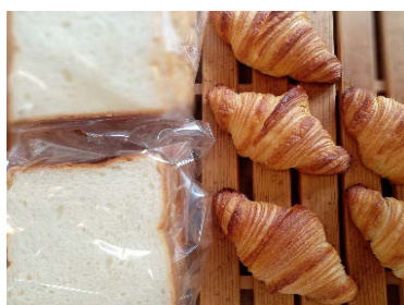
パン・エ・シュクレ（パン）