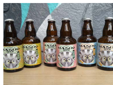
松戸ビール（ビール）