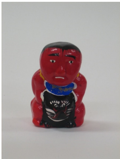
こうのす あか mono くまきん 3 鴻巣の赤物・熊金 (埼玉県)