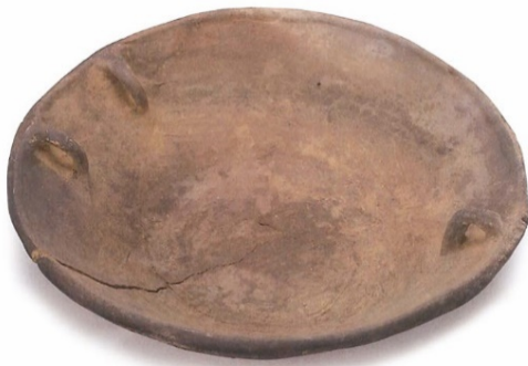
ないじなべ 3 内耳鍋 は鉄鍋の代用品