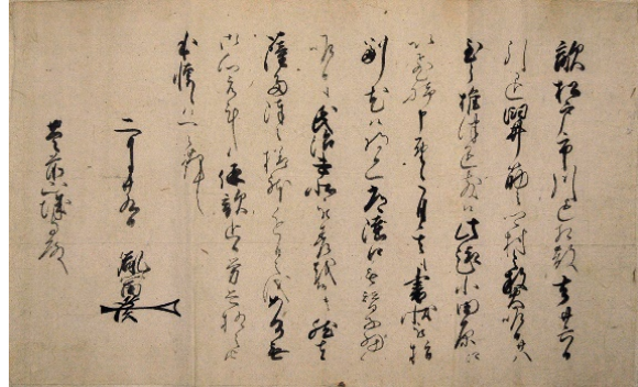
2 里見軍が松戸を襲撃した証拠文書