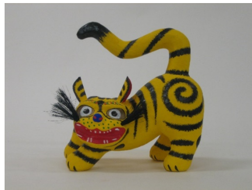
みはるはりご むかい とら 2 三春張子・向かい虎（福島県）