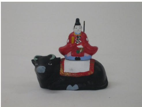
つやまつちにんぎょう うしの てんじん 1 津山土人形・牛乗り天神（岡山県）