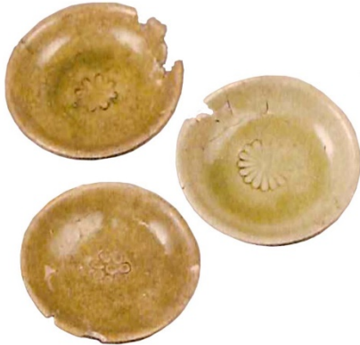
あ かいゆうはそりざら 1 和え物や漬物が載った？ 灰釉端反皿