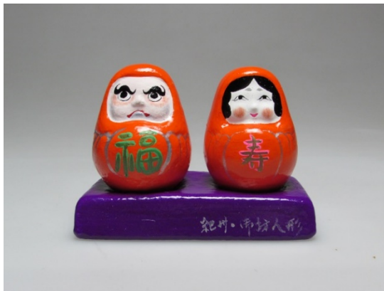
ごぼう めおと 4 御坊人形・夫婦 だるま (和歌山県) ※後期展示