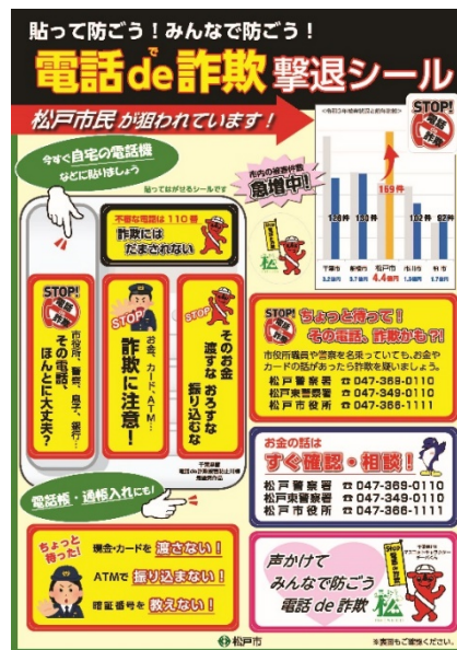
電話 de 詐欺撃退シール