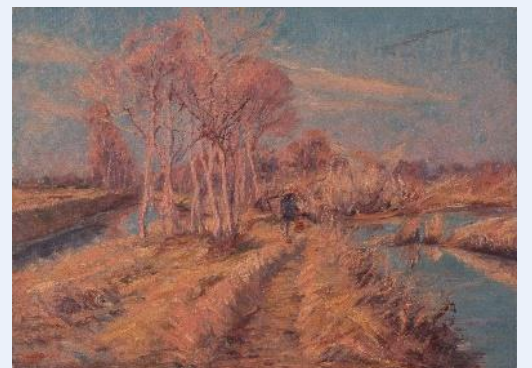
田中寅三《古ヶ崎風景Ⅱ》