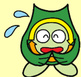
松戸市ごみ減らしシンボルキャラクター・クリンクルちゃん