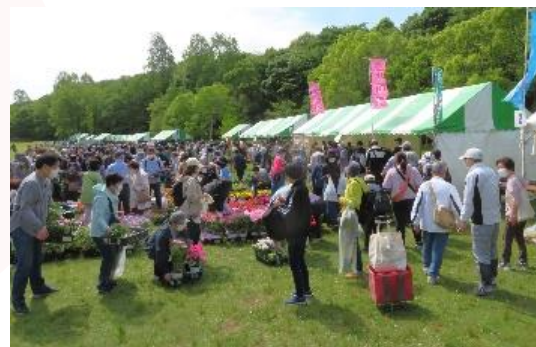
植木・草花・野菜・園芸品 などの販売