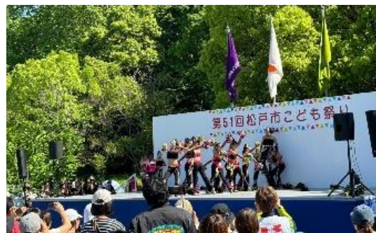
ステージパフォーマンス