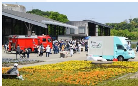
親子向けワークショップ