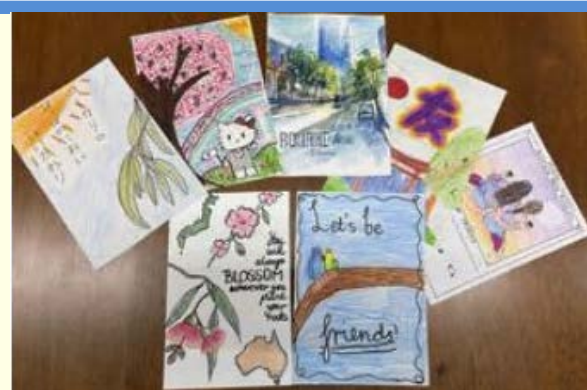
ホワイトホース市から届いた絵手紙

対象: 市内在住、在学、在勤 申し込み: 4月15日(水)[必着]までに、郵送で〒271-0073 松戸市小根本7の8京葉ガスF松戸第2ビル5階 国際推進課へ ※絵手紙は返却しません。