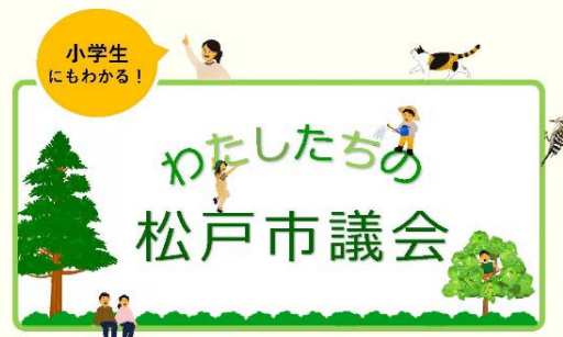
ガイドブック(抜粋)