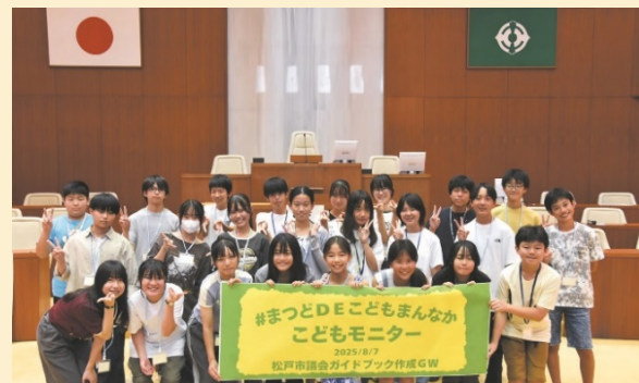
議場に集まったこどもモニター