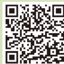
同館ホームページ