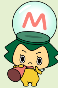
松戸市お知らせキャラクター・まつまつ