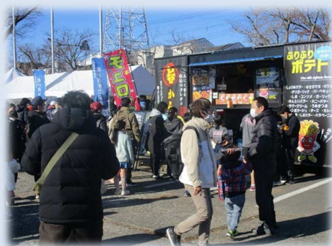
昨年の出店の様子