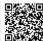
市ホームページ 「避難所での感染症対策」

避難所は感染症拡大防止のために、十分な換気やスペースの確保などをして開設します。それでも感染リスクが高い環境での生活が想定されるため、皆さんも感染拡大防止対策にご協力をお願いします。 ※詳細は市ホームページをご覧ください。