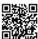
松戸市安全安心メール

災害時の避難指示や避難所開設情報などを事前登録したメールアドレスにEメールでお知らせします。