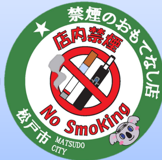
市オリジナルステッカー