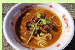
3店舗コラボラーメン

3日間を通してもっとも多くの方が詰め掛けたのが「ラーメンサミット」。地元松戸の「中華蕎麦とみ田」と、全国から選ばれた有名店の計6店舗が集いました。今年が目玉は、「3店舗コラボラーメン」。千葉・神奈川・東京の超有名店である、中華蕎麦とみ田、らぁ麺屋飯田商店、Japanese Soba Noodles 蔦の3店舗がコラボする夢のラーメン。このモリヒロフェスタでしか食べられないラーメンを目当てに、開門前から多くの方が並んでいました。