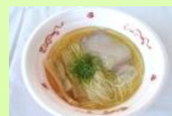
町田汁場 しおらーめん進化