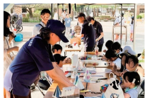
七夕まつりワークショップ