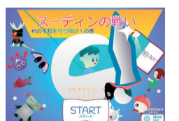
2025受賞作品「スーデインの戦い」