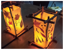
ワークショップで作った「押し葉のランプシェード」