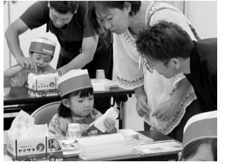
親子でつくるサンドイッチ教室

令和8年度の松戸食育まつりは夏・秋の2部構成。第1弾は「サンドイッチ教室」です。食に関するイベントを通じて、正しい食習慣を身につけましょう。