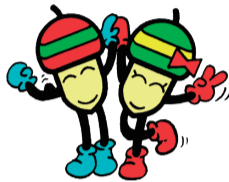
21世紀の森と広場シンボルキャラクター・ドンちゃん・グリちゃん