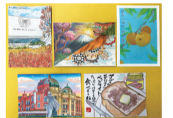
ホワイトホース市から届いた絵手紙