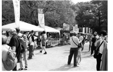
松戸まつり2025「バザール」

市内の目玉商品または市民の趣味やアイデアから生まれた作品を販売する出店者を募集します(飲食は原則一品)。