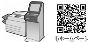
市ホームページ (コンビニ交付サービス)

キャンペーン期間 7月1日(水)～令和9年6月30日(水) ※キャンペーン終了後も、窓口での交付より100円安く取得できます。