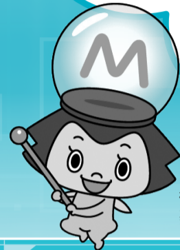
松戸市 お知らせキャラクター まつまつ