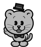
千葉県明るい選挙シンボルキャラクター「せんきょ君」

内容:[せんきょ君]を登場させたデザイン 規格:はがきサイズからハツ切までの大きさ(描画材料は自由) 応募資格:市内在住・在学の小学～高校生 ※応募作品は返却できません。入選者の氏名・学校名・学年は公表します。 ☎ 9月11日(金)(必着)までに、直接または郵送で〒271-8588松戸市役所 選挙管理委員会事務局(☎047-366-7386)へ