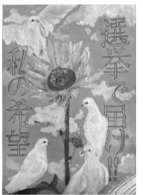
令和7年度最優秀賞

テーマ:明るい選挙の推進 募集要件:四ツ切、ハツ切またはそれに準じる大きさの画用紙(描画材料は自由) 応募資格:市内在住・在学の小学～高校生 ※応募作品は返却できません。入選作品は啓発活動に利用し、氏名・学校名・学年を公表します。 ☎ 9月11日(金)(必着)までに、学校で受け付けている場合は学校に、それ以外の場合は直接または郵送で〒271-8588松戸市役所 選挙管理委員会事務局(☎047-366-7386)へ