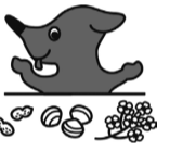
千葉県マスコットキャラクターチーバくん