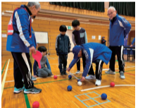
ポッチャ体験イベント

スポーツを始めるきっかけづくりとなる体験教室やイベントなどを開催する団体を募集します。団体は事業を企画し、市は会場確保や広報支援を行います。「競技の魅力をもっと広めたい」「子どもや地域の皆さんにスポーツを楽しんでもらいたい」。そんな思いを持つ団体・企業のご応募をお待ちしています。