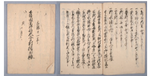
大谷口大熊家文書

市内大谷口付近の名主を務めた大熊家に残された、5,351点からなる近世・近代の文書群で、当時の村の政治や女性の旅日記など地域の歴史を物語る貴重な実物資料です。※現在は市立博物館に寄贈されています。