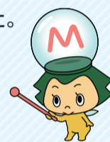
松戸市お知らせキャラクター まつまつ