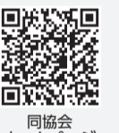
同協会ホームページ

募集数 一般埋蔵施設335カ所、芝生埋蔵施設40カ所、合葬埋蔵施設1,540体 申込書配布 6/12(金)～7/3(金)の間に、市民課・予防衛生課・各支所・行政サービスセンター・同霊園管理事務所など ☎6/12(金)～7/3(金)(消印有効)の間に、東京都公園協会ホームページまたは申込書を郵送で同協会へ ☎同協会霊園課募集専用番号 ☎0570-783-802(ナビダイヤル・有料)