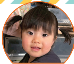
さきちゃん 令和6年5月生

パパとにいにおふざけに、いつも大笑いのさきちゃん! これからもたくさん笑って過ごそうね。