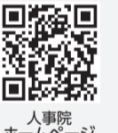
人事院ホームページ

試験日 1次試験 9/6(日) 2次試験 10/14(水)～23(金)のうち指定の日時 ☎高卒程度 ☎6/12(金)9時～24(水)(受信有効)の間に、人事院ホームページで ☎松戸税務署総務課 ☎363-1171(内線205)