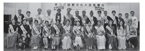
まつど国際文化大使

市内で開催される国際理解を促す講座や交流イベントで、外国や日本の文化を紹介する文化大使になってみませんか。 対象 外国人 在留期間が1年以上ある在留資格を持ち、自国の文化を紹介できる人 ※日本語で会話ができることが望ましい。 日本人 日本の文化または1年以上滞在した国・地域の文化を紹介できる人 任期: 9月1日～令和9年9月30日(予定) 選考方法: 書類審査、面接 ※自薦・他薦を問いません。 募集人数: 約30人 用5月31日(日)までに、申し込みフォームで