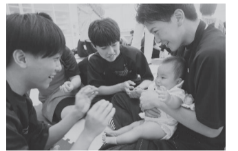
松戸向陽高校の生徒とふれあう赤ちゃん

普段赤ちゃんと接する機会の少ない高校生たちが、生命の大切さを学ぶ機会として実施します。 日時: 6月17日(水)10時～11時ごろ 会場: 県立松戸向陽高等学校 内容: 抱っこ、ふれあいあそびなど 対象: 市内在住または実施学校の卒業生で、おおむね生後5カ月～1歳6カ月の首がすわっている乳幼児とその保護者 定員: 先着15組程度 持ち物: 母子健康手帳、エコ写真(お持ちの場合)、おもちゃ、おむつなど 費用: 無料 用5月29日(金)までに、(市HP)掲載の松戸市オンライン申請システムで