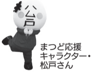
まつど応援キャラクター 松戸さん

●子どもが楽しめるゲーム ●クイズ ●親子で楽しめる工作コーナー ●保健師・管理栄養士・歯科衛生士への相談ブース ●私立幼稚園の特色紹介など