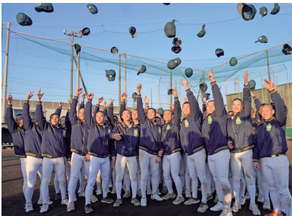
センバツ出場が決まり歓喜する野球部員たち