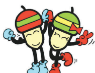
21世紀の森と広場 シンボルキャラクター ドンちゃん・グリちゃん