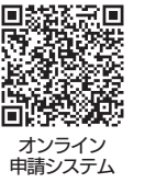
オンライン申請システム