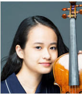
HIMARI ©Naruyasu Nabeshima