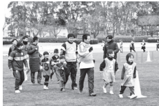
ウォーキングレッスン

年齢、性別、障害、競技レベルなどに関係なく、みんなで楽しみながら効率的に「歩く」運動プログラムです。