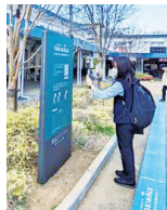
エリアに設置されたチェックポイント

「団地の歴史」などのテーマごとに分かれて、健康プログラム「TOKIWALK」を体験しながら、まちの魅力を発見するウォーキングイベントです。 日時:2月28日(土)10時～12時 集合場所:常盤平団地中央集会所(常盤平3の27の2) 定員:先着30人 費用:無料 ④2月26日(木)までに、申し込みフォームで