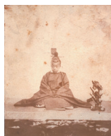
徳川昭武が写る最古の写真