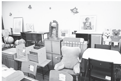
同工房内に並ぶリユース品

日 2月の(日)10時～15時、2/4(水)・12(水)・18(水)・25(水)各10時30分～14時30分 同 環境政策課 ☎366-7089