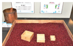
升(ます)で小豆の量を量る体験

今の便利なくらしが当たり前になる前の生活の様子を、昔の道具やくらしの工夫から紹介します。