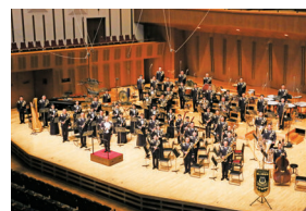
陸上自衛隊中央音楽隊