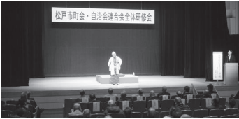
全体研修会の様子