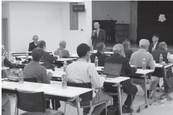
地区意見交換会の様子

毎年各地区で地域の代表者である町会・自治会長が、地域の課題についてテーマを出し、市長やそのテーマの担当課と意見交換を行っています。