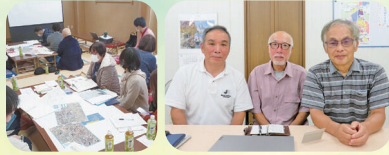
左から：小倉会長、 新橋副会長、平川副会長