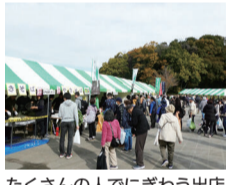
たくさんの人でにぎわう出店

会場:21世紀の森と広場パークセンター広場前 内容:松戸産農産物・草花・豚汁・焼きそば・焼きねぎなどの販売、太鼓の演奏