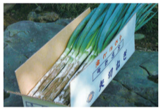
採れたての矢切ねぎ

問 11月17日(月)から①12月12日(金)②令和8年1月14日(火)の間に、JAとうかつ中央各店舗窓口・経済センター(平日のみ)またはJAタウンホームページ内「愛情いちばん館」で