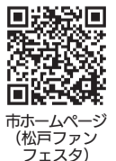
市ホームページ (松戸ファンフェスタ)