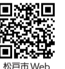
松戸市Webけんしん予約システム