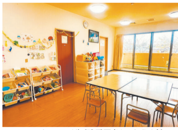
ショートステイ先(晴香園(はるかえん))