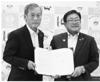
広田一恭倉吉市長(右)