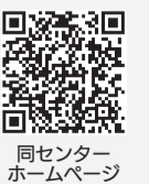
同センターホームページ

日程などの詳細は同センターホームページで 会場 新松戸・常盤平各市民センター他 費用 1,500円から 問い合わせ 同センター ☎330-5005