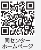
同センターホームページ

9/10(火)②10/2(水)各9時30分から 会場 ①シニア交流センター ②六実市民センター 内容 臨時的・短期的または軽易な就業を希望する市内在住の60歳以上 定員 各先着40人程度 申込 申し込みフォームまたは電話で同センター ☎330-5005へ ※詳細は同センターホームページで