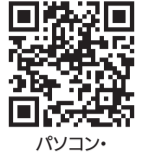
パソコン・スマートフォン版