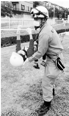
子どもレスキュー隊体験

内容: 救助工作車・水難救助車の展示、消防自動車の乗車体験、防火衣着用体験、子どもレスキュー隊体験、消防音楽隊の演奏、地野菜直売 費用: 無料