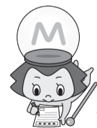
松戸市お知らせキャラクター・まつまつ

会 馬橋東市民センター 対 両日参加できる65歳以上 定 先着40人 申 10/7(月)9時から、電話で