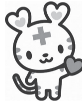
Japanese Red Cross Society 日本赤十字社公式キャラクター ハートラちゃん