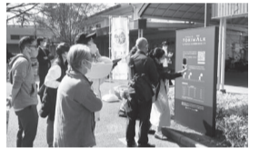
昨年度の体験イベント