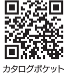
カタログポケット

広報まつどをスマートフォンで閲覧 できます。10言語・自動読み上げに 対応。Read in multi languages!