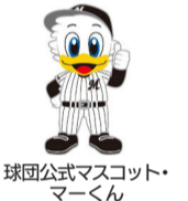
球団公式マスコット・マーくん

問 3月1日(金)12時~3月24日(日)22時の間に、専用ホームページで ※1組1試合のみ応募可。 ※抽選結果は4月上旬にEメールで応募者全員に連絡します。