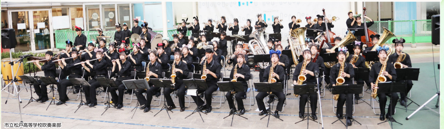
市立松戸高等学校吹奏楽部