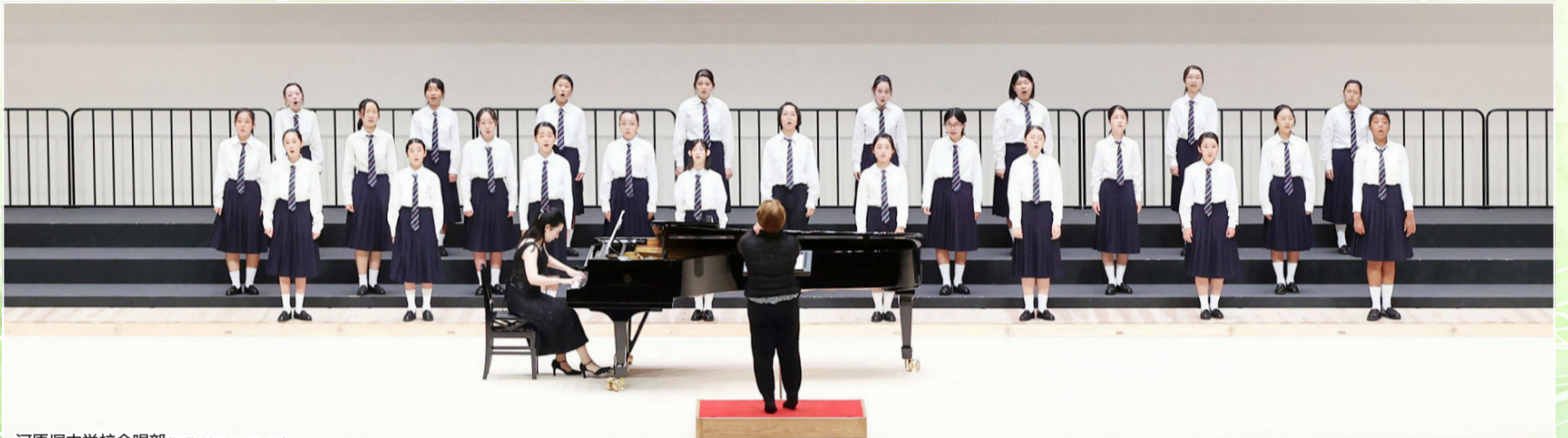
河原塚中学校合唱部