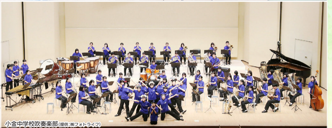
小金中学校吹奏楽部