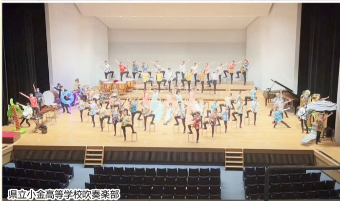
県立小金高等学校吹奏楽部