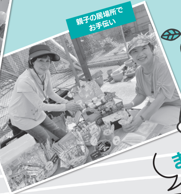
親子の居場所でお手伝い