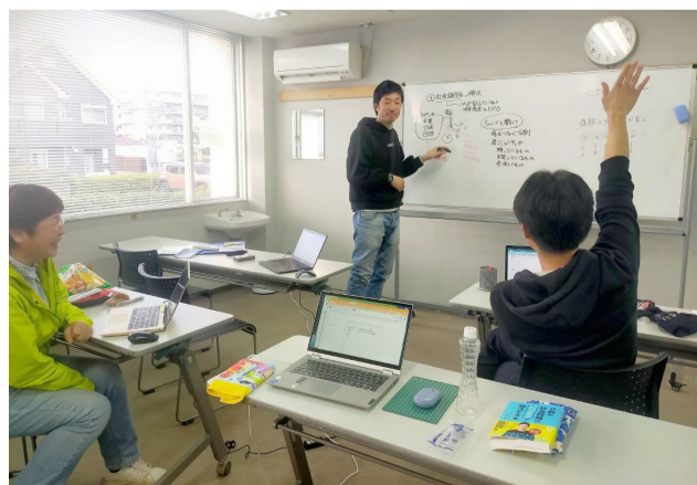
学びの会で持続可能な市民活動について話し合う様子

松戸は市民活動が活発です。何かやりたいけどもやもやしているとか、市民活動をしたいけど1人だと少し動きづらいと思っている人は、ぜひ入塾をお勧めします。同じ地域のやる気があって、高いモチベーションを持つ人とつながりを持てる機会は貴重だと思います。