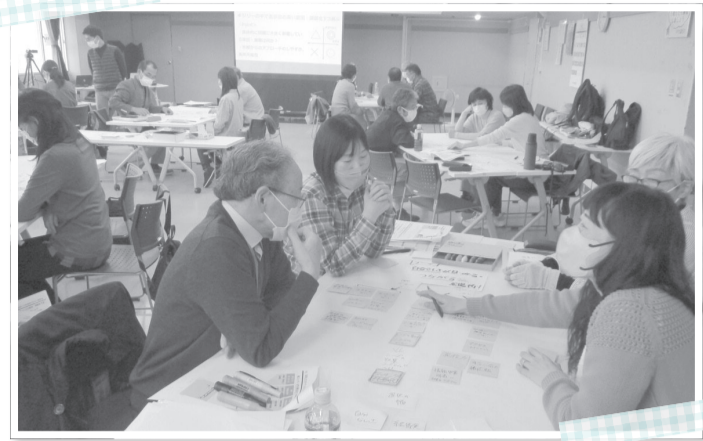
地域課題を学ぶワークショップ

■6月18日(日)(必着)までに、申し込みフォームまたはEメール、郵送で申込書、レポート「まつど地域活躍塾で学びたいこと、体験したいこと」(400字以内)を〒271-0094上矢切299の1まつど市民活動サポートセンター☎hai_saposen@matsudo-sc.com(☎047-365-5522)へ ※申込書はまつど市民活動サポートセンターで配布、または市ホームページからダウンロードできます(申し込みフォームで申し込む場合は提出不要)。