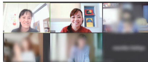
オンライン交流での居場所づくり