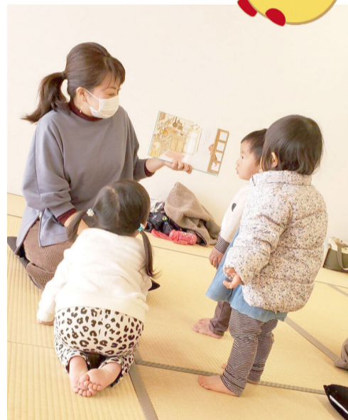
絵本の読み聞かせ