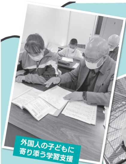
外国人の子どもに寄り添う学習支援