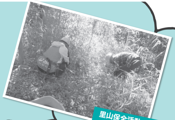
里山保全活動での草刈り