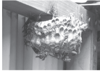
アシナガバチの巣