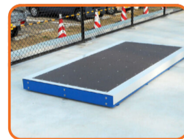
マニュアルパッド