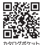
カタログポケット

広報まつどをスマートフォンで閲覧 できます。10言語・自動読み上げに 対応。Read in multi languages!