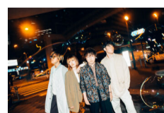
レトロリロン(映像出演)