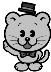
千葉県明るい選挙 シンボルキャラクター せんきよ君