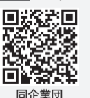
同企業団ホームページ

採用予定日 令和6年4月 職種 土木・機械 ※詳細は同企業団ホームページで 問 同企業団総務調整室 ☎345-3211