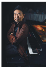
ピアノ奏者・西川悟平