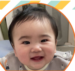
晴瑠ちゃん 令和4年7月生

毎日色々な可愛い表情をして癒やしてくれる優ちゃんが大好きだよ。これからの成長も楽しみです。