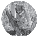
コアラ(オーストラリア固有種)

施設内に配置されたクイズに答えて、オーストラリアやホワイトホース市に詳しくなろう! 全問正解者には記念品をプレゼントします。