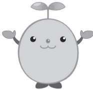
松戸市協働のまちづくり 公式キャラクター 芽でるくん