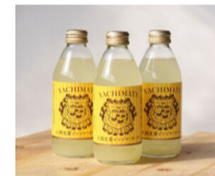
八街生姜ジンジャーエール