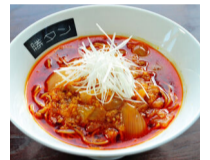
勝浦タンタンメン