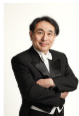
千葉交響楽団指揮・山下一史