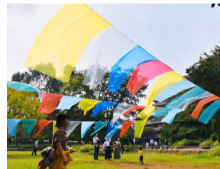
聖徳大学生涯学習研究室 アートパーク作品