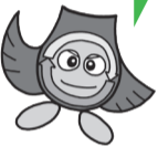
松戸市ごみ減らしシンボルキャラクター・クリンクルちゃん