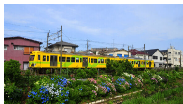
流鉄の景観