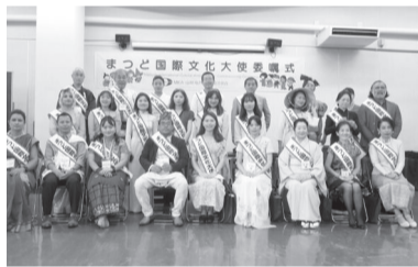
現在のまつど国際文化大使の皆さん

申 5月15日(月)~31日(水)の間に、申し込みフォームで(書類・面接選考あり)