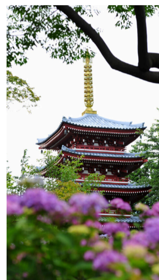
本土寺とあじさい