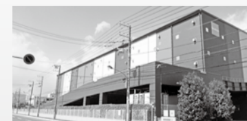
グッドマン松戸(松飛台)