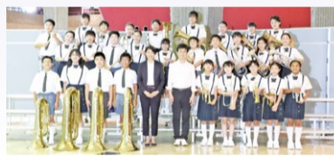
横須賀小学校 brassバンド部

4年ぶりに有観客で開催する今回は、特別企画として、映画『バックドラフト』のテーマ曲の演奏に合わせて、救助隊が迫力の演技を披露します。