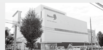
メリーチョコレートカムパニー松戸工場(稔台)