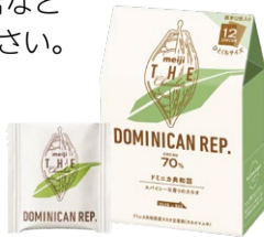
明治ザ・チョコレート

明治ザ・チョコレートとは （株）明治が直接農家を支援した地域のカカオ豆のみ使用している、SDGsに配慮したチョコレートです。