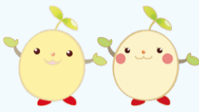
松戸市協働のまちづくり 公式キャラクター・ 芽でるくん・芽るるちゃん