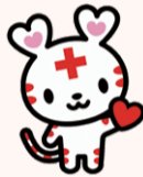
日本赤十字社 公式キャラクター 「ハートラちゃん」

小・中学生や育児中の保護者向けの赤十字体験イベントを行います。子どものボランティア精神が育まれます。ぜひご参加ください。