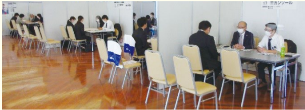
各企業のブースで説明を受ける求職者