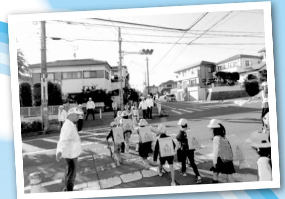
※写真は昨年度以前に撮影したものを使用しています。 また、新型コロナウイルス感染拡大防止のため、中止したイベントもあります。