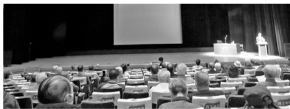
座席の間隔を空け感染防止対策を行いました

毎年1回、松戸市町会・自治会連合会主催で全体研修会を開催しています。令和2年度は、新型コロナウイルス感染拡大防止のため、広い会場を使用し座席の間隔を空ける他、マスク着用や換気などの対策を講じて開催しました。全体研修会では講師を招き、町会・自治会活動に役立つ講演を行っています。