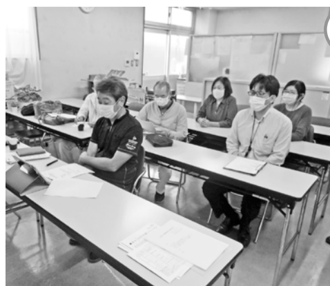
離れた場所でも話し合いができました